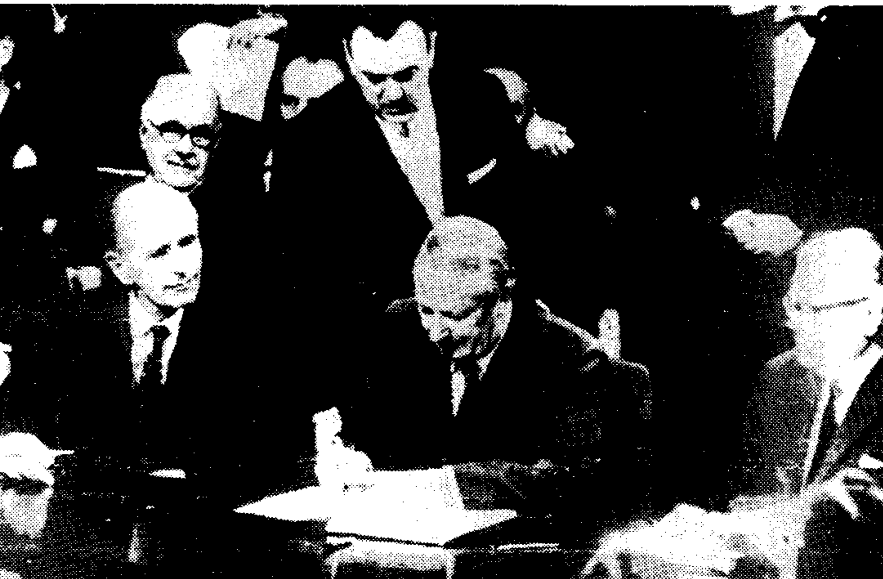
Ο Βρετανός πρωθυπουργός Έντουαρντ Χρήστος υπεγράφη τις ιστορικές συμφωνίες της εισόδου της Βρετανίας στην Ε.Ο.Κ.